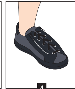
4 Fermer la chaussure avec les lacets