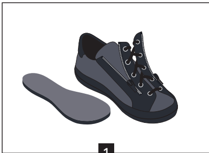
1 Ouvrir la chaussure en grand avec les zip

Les semelles entretoises pourront être utilisées lorsque les pieds auront dégonflé et que vous souhaitez ou devez continuer à porter les chaussures ADAPTATIV.