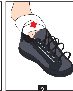
3 Glisser le pied dans la chaussure