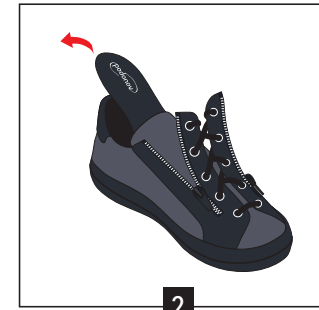
2 Extraire la semelle de confort de la chaussure