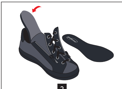
3 Glisser votre semelle entretoise au fond de la chaussure