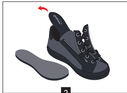
2 Extraire la semelle de confort du fond de la chaussure