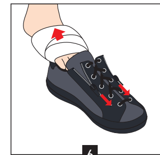
6 Utiliser les zips pour enfiler ou retirer la chaussure