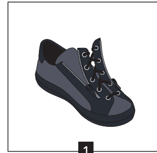
1 Ouvrir la chaussure en grand avec les zip