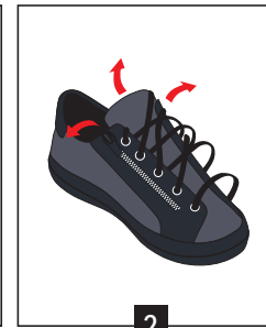
2 Ouvrir la chaussure en grand en écartant les 2 pans latéraux