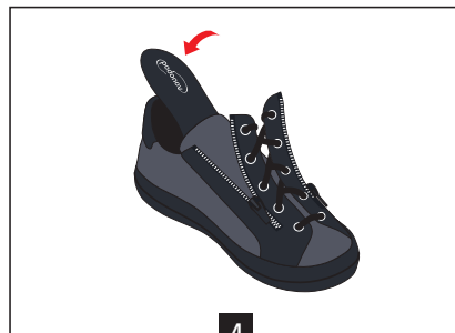
4 Remettre la semelle de confort sur la semelle entretoise