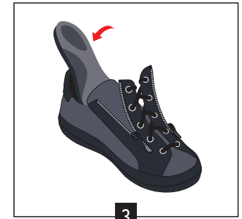
3 Glisser votre semelle correctrice de la chaussure