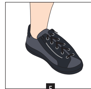
5 Réglage lacet fait

Une fois le réglage de la fermeture de la chaussure fait avec les lacets, utiliser uniquement les zips pour enfiler et retirer votre chaussure.