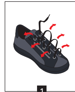
1 Desserrer les lacets sans ouvrir les zips