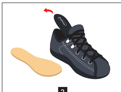
2 Enlever la semelle de confort (noire) de la chaussure