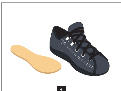
1 Desserrer les lacets afin de bien ouvrir la chaussure

Si vous souhaitez ou devez continuer à porter les chaussures HALTEN, les semelles entretoises pourront être utilisées lorsque vos pieds auront dégonflé.