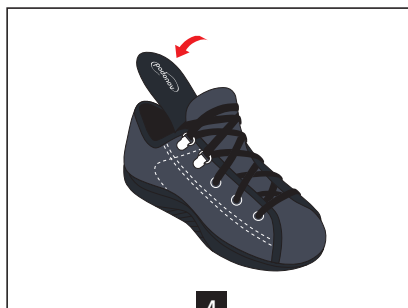
4 Remettre la semelle de confort par-dessus la semelle entretoise