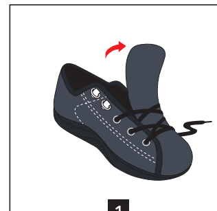
1 Bien desserrer les lacets jusqu'à la pointe et relever la languette au maximum

Votre pansement rentre dans la chaussure sans douleur: