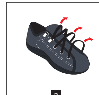
2 Desserrer les lacets au maximum afin de favoriser le passage du pied