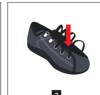
3 Bien plaquer la languette au fond de la chaussure