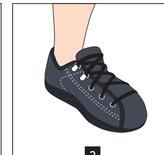
3 Serrer les lacets