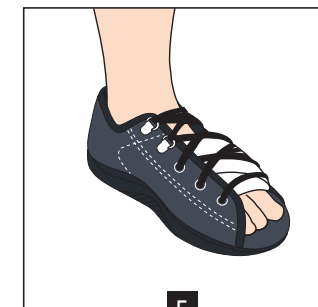
5 Resserer les lacets directement sur le pansement