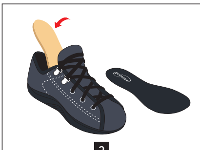
3 Glisser votre semelle entretoise dans la chaussure