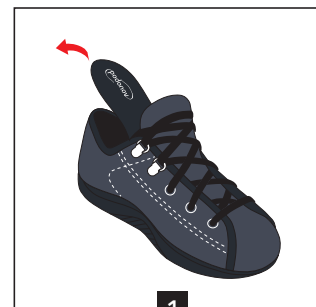
1 Enlever la semelle de confort du fond de la chaussure

Votre pied et vos pansements sont trop volumineux pour rentrer dans la chaussure fermée, vous pouvez mettre la chaussure comme indiqué ci-dessous