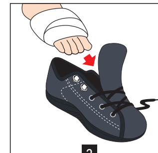
2 Glisser le pied avec le pansement dans la chaussure